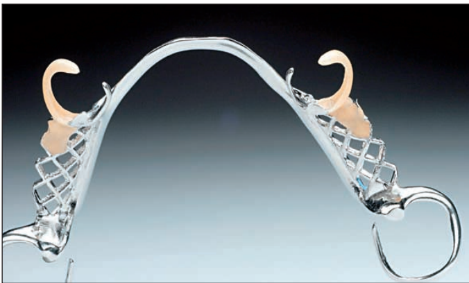
Modellguss aus Wirobond LA mit Dental-D-Klammern

In der Anfangsphase von Permadental B.V. wurden nur Kronen, Brücken und Modellgussprothesen angeboten. Heute umfasst die Produktpalette die gesamte Prothetik. Sie bietet verschiedene moderne Materialien wie Cercon, Procera, Empress II, InCeram oder Titan und seit neuem auch die Galvanotechnik. Auch für Allergiker können Vollprothesen oder Modellgussprothesen aus speziellen Kunststoffen angefertigt werden. Selbstverständlich gelten für Permadental dieselben aktuellen Bestimmungen wie für deutsche Unternehmen. Das Labor ist nach ISO 9001:2000 / EN ISO 9001:2000 zertifiziert.