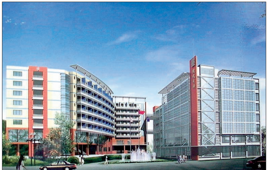
Eine naturgetreue Computerzeichnung des neuen Labors

Im November 2004 wird das Labor in ein neues Gebäude wechseln, welches auf sechs Etagen Platz für 1500 Techniker bieten wird und somit zum größten Labor in Asien aufsteigt. Trotz der großen Technikeranzahl kann man sich auf Grund