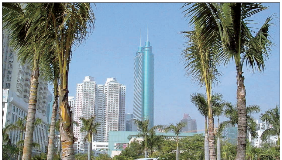
Blick auf den Großwirtschaftsraum Hongkong