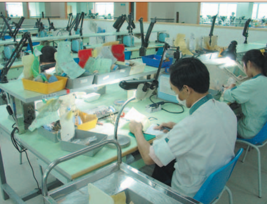
Labor in Shenzhen: Hier bekommen die Zähne ihren Schliff.

Die Beiträge dieser Rubrik gründen sich auf Informationen der Hersteller; sie geben nicht unbedingt die Meinung der Redaktion wieder.