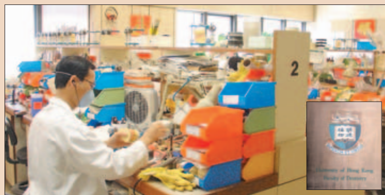
Hort des Wissens: Ein Einblick in die Dental School der „University of Hong Kong“. Die Ausbildungsleitung im neuen Dentallabor in Shenzhen liegt in deren Dozenten Händen.

* Dabei verdienen die Techniker für chinesische Verhältnisse recht gut, langjährige Mitarbeiter bringen es nach Angaben der Laborleitung durchaus auf umgerechnet ca. 1.000 US$ und mehr im Monat. Zum Vergleich: Eine Wohnung in Shenzhen kostet umgerechnet ca. 100 bis 150 US$.