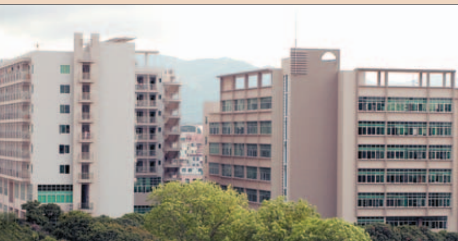
Gesamtansicht zum besseren Überblick: Gearbeitet wird in dem neuen Laborgebäude rechts, Freizeit und Wohnen finden in dem linken Gebäude ihren Platz.