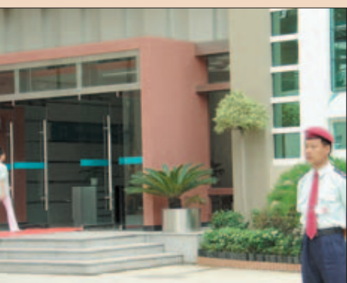
Gut bewacht: Der Eingang zum „Modern Dental Laboratory“ in Shenzhen.

** Umgerechnet 2 € gibt die Laborleitung pro Techniker und Tag für die Speisen aus.