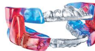
Respire Blue EF+